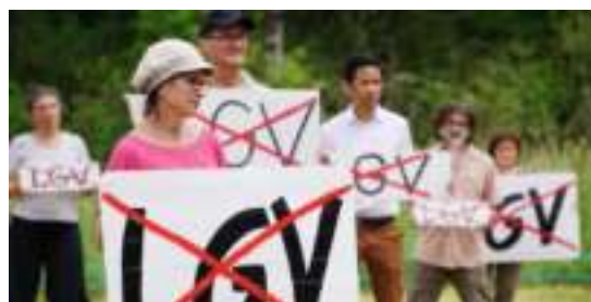
Pendant le tournage du clip vidéo

Actions de désobéissance civile non violente, résistances solidaires, blocages et une ZAD !