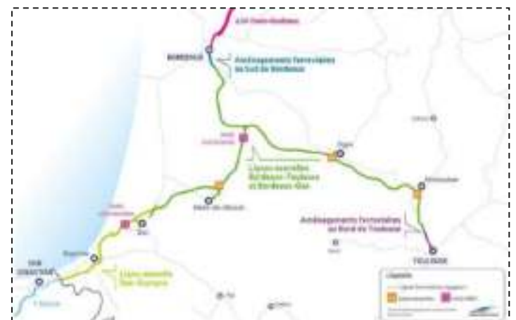
Carte du Grand Projet du Sud-Ouest © SNCF Réseau

NON AUX AFSB ET AFNT DU GRAND PROJET DU SUD OUEST