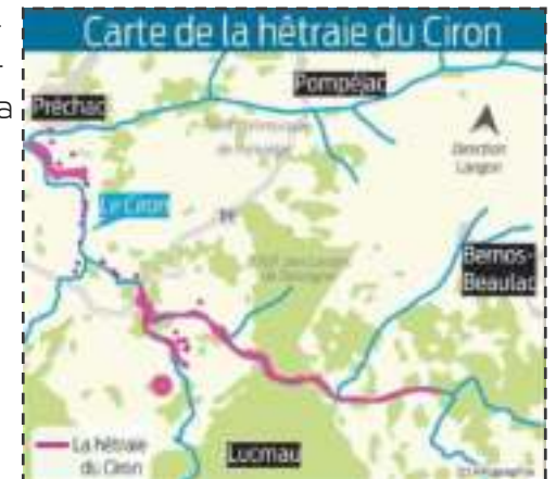
Carte de la hêtre du Ciron - Sud-Ouest

Pour aller plus loin sans aller plus vite