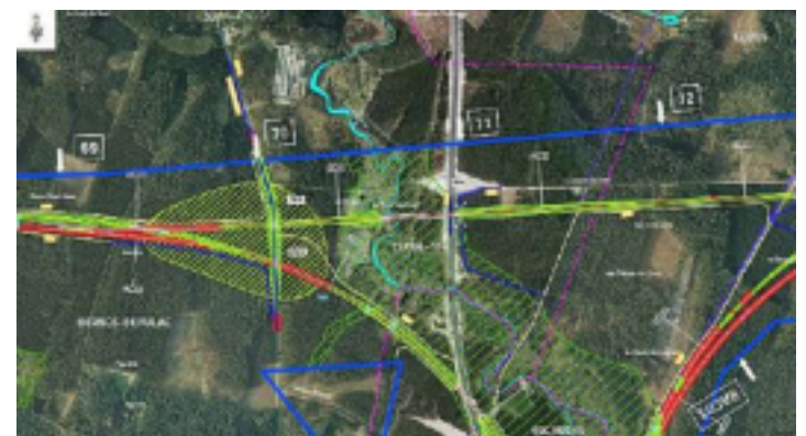
Extrait du tracé du GPSO - Comité de pilotage (COPI) 2012