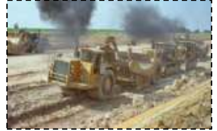
Chantier LGV Tours-Bordeaux