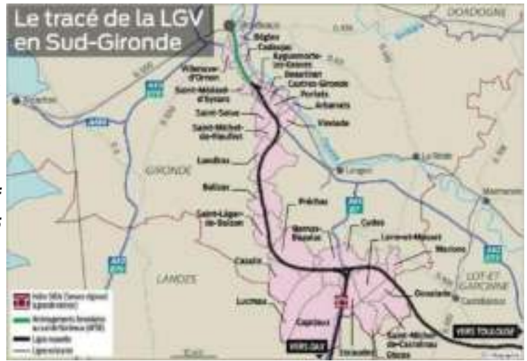
Le tracé de la LGV en Sud-Gironde - Sud-Ouest

» Les patrons de Total, EDF et Engie « appellent les Français et les entre-